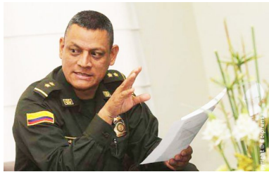
Estalla la corrupción en el Inpec