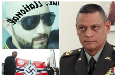
Alias Nitido el peligroso Neonazi que burló al Inpec

ONE COMMENT ON THIS POST TO "AUMENTO DE EXTORSIONES DESDE LAS CÁRCELES PONEN A TEMBLAR AL DIRECTOR DEL INPEC "