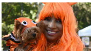
Los perros lucieron sus mejores disfraces en el desfile anual de perros en Tompkins Square, EEUU