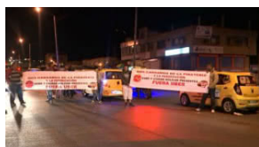
Los taxistas bogotanos salieron a las calles para protestar contra las plataformas digitales