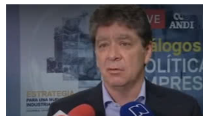
Fiscalía debe definir casos que pueden ser juzgados por la JEP: empresarios