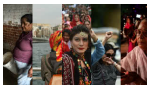
Las 10 ciudades más peligrosas para las mujeres, según la fundación 'Thomson Reuters'