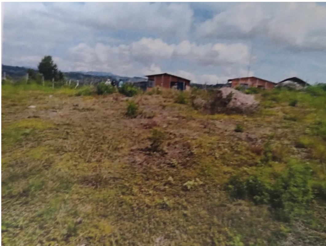
Fotos del lote Pavas matricula inmobiliaria 370-0369713 en OCTUBRE 27-2022, 2do avalúo.