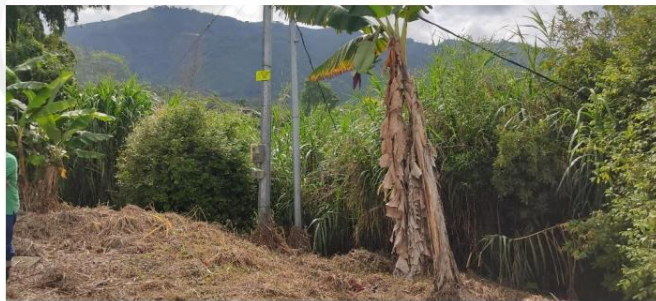
Limpieza y descapote

De la información recaudada por el despacho a raíz del requerimiento realizado previo a decidir sobre la apertura formal del incidente de desacato, se evidencia que el ente territorial ha adelantado trámites para el cumplimiento las obligaciones que quedaron a su cargo en la sentencia aprobatoria de pacto de cumplimiento, y ha llevado a cabo labores relacionadas con las mismas, lo cual también se soporta en las fotografías aportadas, las cuales dan cuenta de las actividades que han realizado: