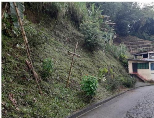
Limpieza y descapote