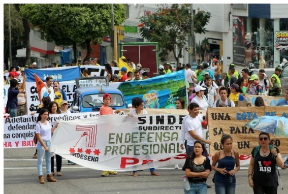
Imágenes de la marcha S.O.S. X SANTURBÁN (2015). Fuente Compromiso, 2015 1