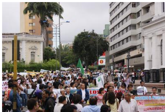
Imágenes de la marcha del 5 de octubre de (2010).