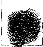
Huella Índice Derecho

Hoy viernes 14 de enero de 2020 a las 03:14:06 p.m. autorizo e autorizo el anterior reconocimiento.