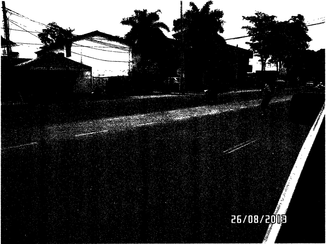
FOTOGRAFIA NUMERO 2 – Esta fotografía deja ver una de las Aberturas en el Separador Central de la Autopista del Sol, que une las poblaciones de Turbaco, Arjona, Gambote, Sincerín, Malagana con la Ciudad de Cartagena, es muy notable la longitud de la Abertura del Separador central de la Autopista.