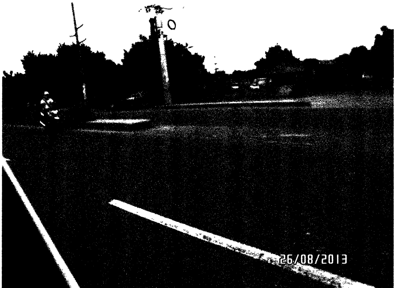
FOTOGRAFIA NUMERO 4 – En la toma fotográfica se puede ver otra de las Aberturas del Separador Central de la Autopista del Sol que tienen sus longitudes acordes con las normas vigentes para este tipo de carreteras en lo que tiene que ver con las velocidades de diseño por el tipo de vías para el cual fueron diseñadas.