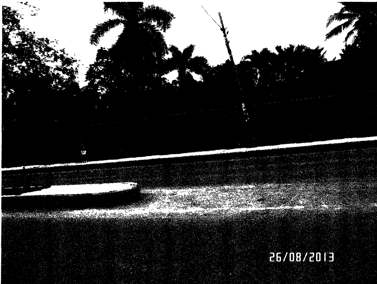
FOTOGRAFIA NUMERO 6 – Esta foto permite ver un tramo de la Autopista del Sol, que se viene usando ya, sin ningún tipo de crítica por parte de la población beneficiada con el servicio que ya viene recibiendo por el uso de la precitada vía.