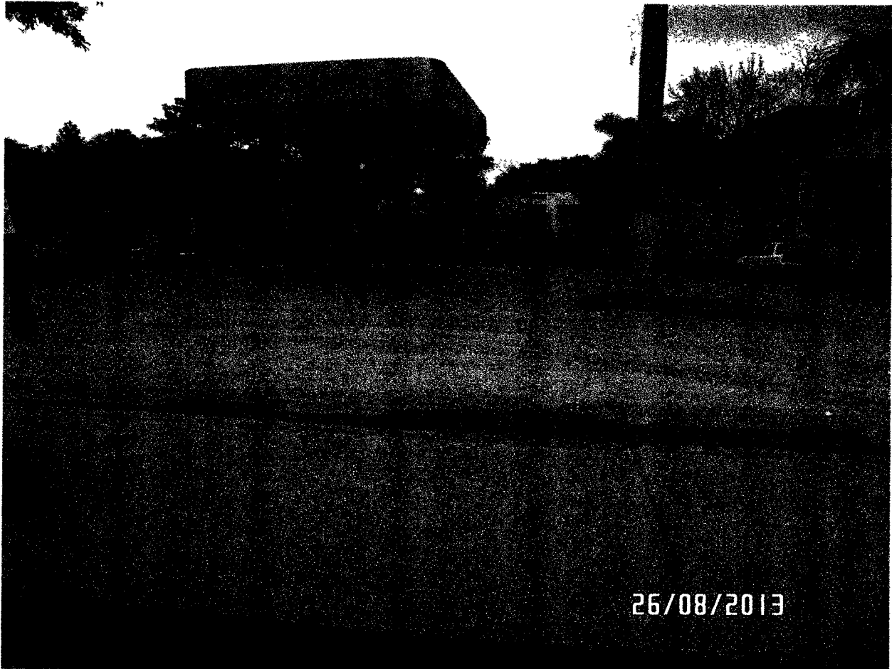
FOTOGRAFIA NUMERO 3 – Esta foto permite ver la Estación de Suministros de Combustibles para vehículos de la Empresa Gazel, cuyos propietarios se encuentran a gusto con las medidas de las aberturas del separador que se encuentra trabajando ya en el sector de la Estación de Policía del Municipio de Turbaco.