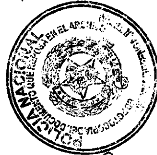
JUAN CARLOS PINZÓN BUENO