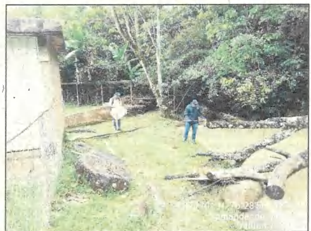
Fotos 1 y 2. Punto inicial – Franja forestal protectora ocupada por infraestructura de piscina e instalaciones distancia 5m.