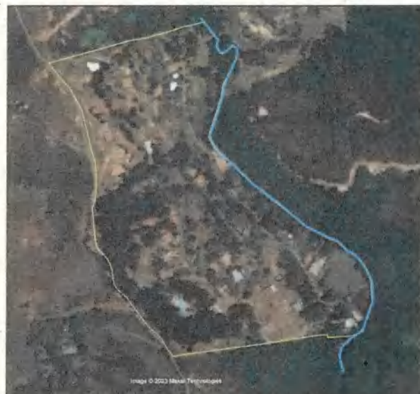
Imagen 5. Fotografía año 2016.