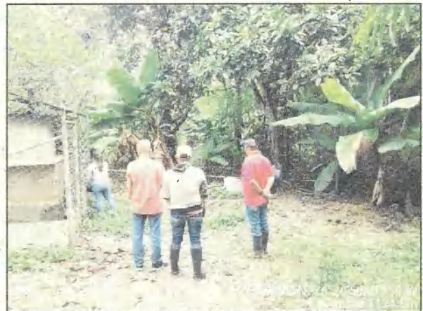
Fotos 5 y 6. Franja forestal protectora ocupada por infraestructura vivienda e instalaciones (Lote 38), distancia 8,70m.