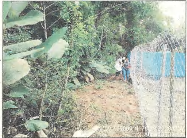
Fotos 9 y 10. Franja forestal protectora ocupada por infraestructura de corral e instalaciones, distancia 4,30m.