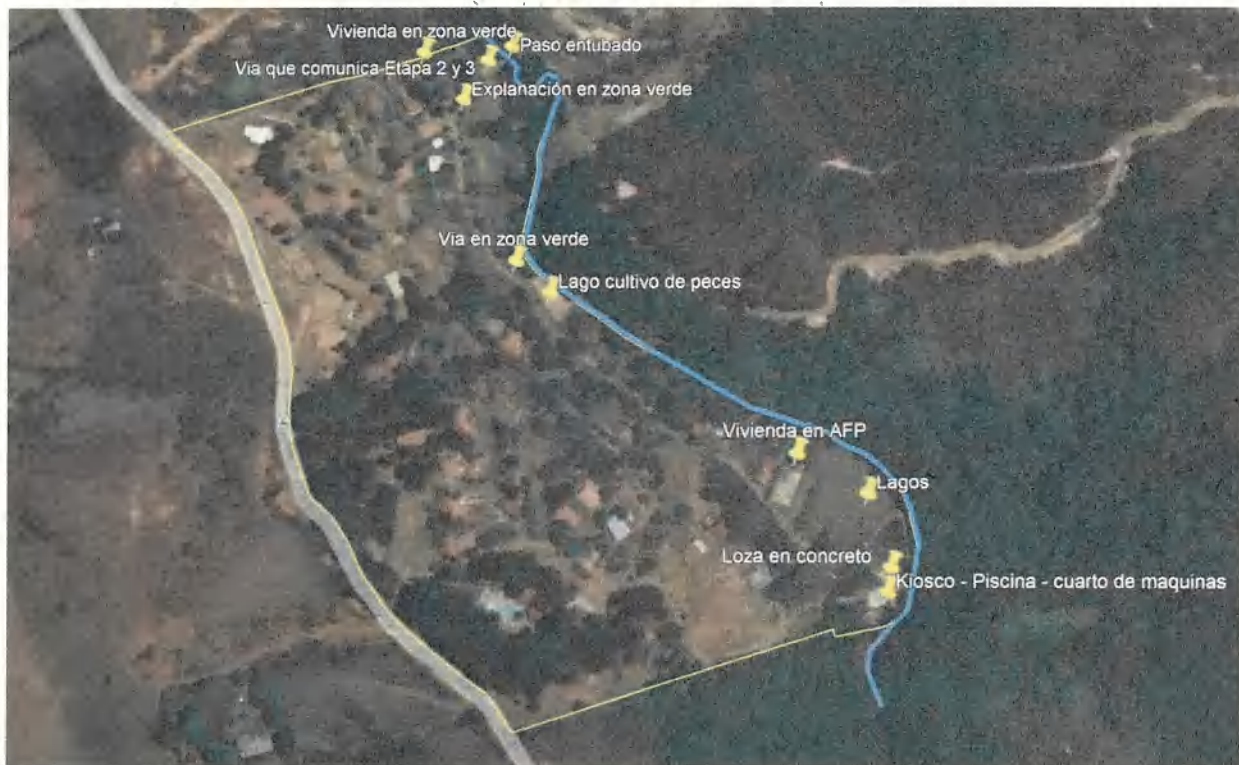
Imagen 2: Ubicación de las estructuras construidas sobre la Franja Forestal Protectora de la Quebrada La Búgura.

Con la construcción de estas estructuras, se evidencia que no se respetó la franja mínima de 30 m desde las líneas de mareas máximas de la Quebrada La Búgura. En la imagen N°2 se presenta la ubicación de estas estructuras dentro de la Franja Forestal Protectora: