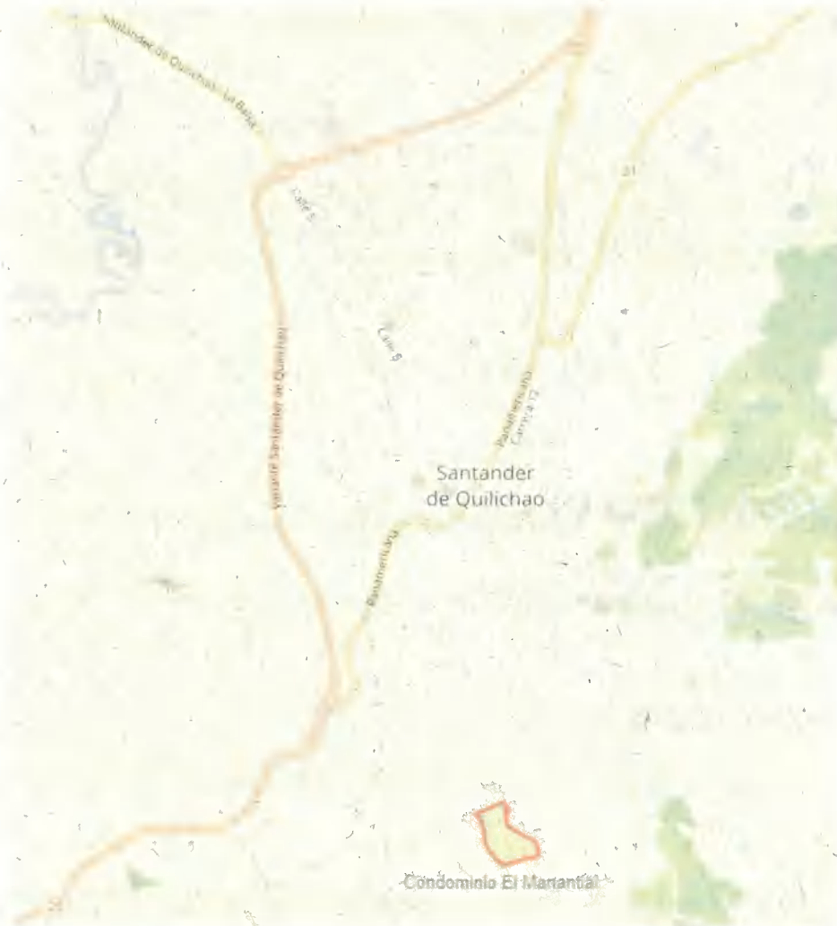
Imagen 1. Localización Condominio-Campestre El Manantial.