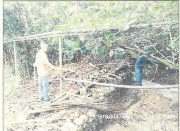
Fotos 3 y 4. Franja forestal protectora ocupada por infraestructura de lagos e instalaciones, distancia 4m.