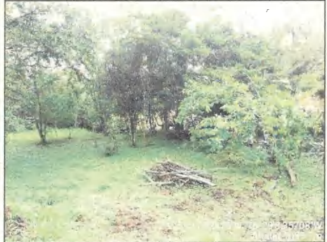
Fotos 11 y 12. Área franja forestal protectora sin cobertura arbórea y con árboles dispersos con pastos, distancia 4,30m.