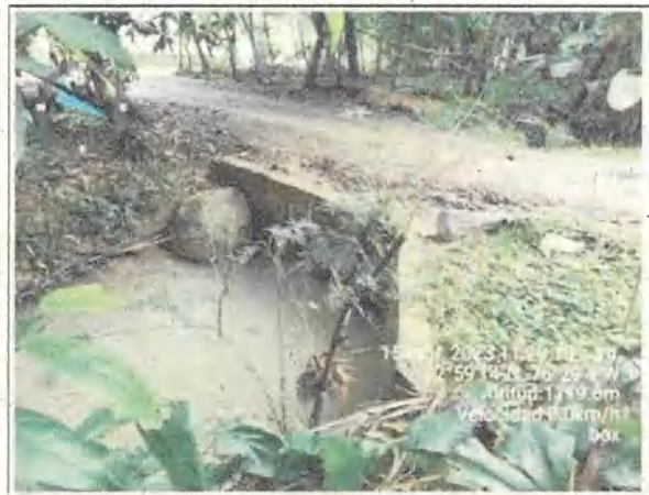
Foto 13 y 14: Ubicación de alcantarilla sobre la Quebrada La Búgura.