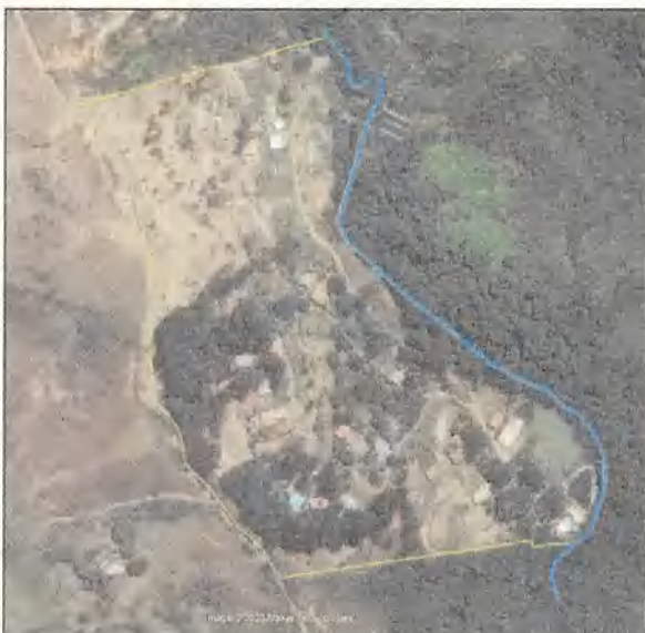
Imagen 4. Fotografía año 2012.