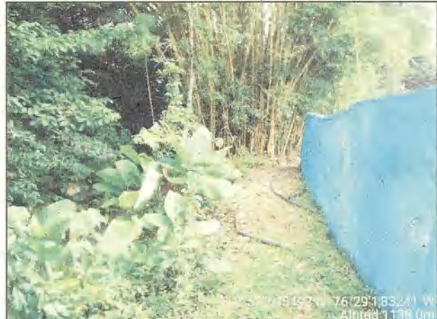
Fotos 7 y 8. Franja forestal protectora ocupada por infraestructura de lago e instalaciones (Lote 38), distancia 4,30m.