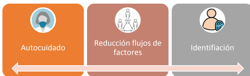
Ilustración 1. Estrategia de Mitigación de Riesgo de Contagio por COVID-19.

A partir de esta condición para la consideración del riesgo dentro de esta categoría (uso permanente del tapabocas, o mascarilla) y en aras del adecuado manejo del nivel de riesgo identificado, se estructura la presente estrategia de mitigación del riesgo (entiéndase protocolo de gestión de riesgo de contagio por contingencia COVID-19) en tres pilares que orientan cada actividad del protocolo hacia el mismo objetivo: el autocuidado, la reducción de flujo de factores de riesgo y la identificación de todos los asistentes.