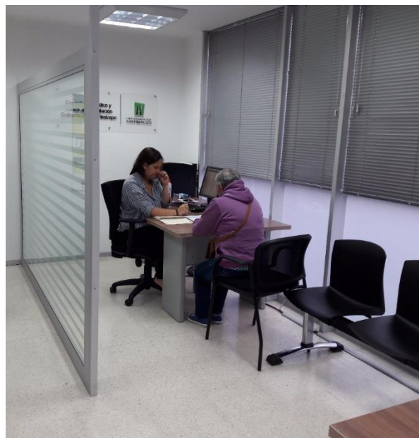
Asesorías son realizadas con el apoyo de los consultorios jurídicos de cuatro universidades de Manizales

Cada usuario queda registrado en una base de datos y se le hace seguimiento a la queja formal, desde su recepción hasta la respuesta final del despacho y la solución definitiva.