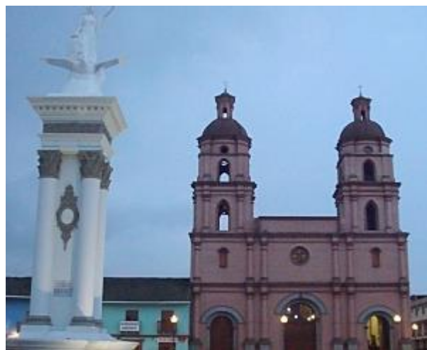
Una mirada a Ipiales (Nariño).