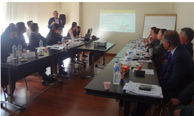
CRM Boyacá 6 de marzo de 2018

La Comisión Regional de Moralización de Boyacá realizó una mesa técnica de seguimiento a los proyectos de vivienda de interés prioritario, denominados: “Estancia el Roble” y “Torres del Parque, sobre los cuales se han presentado denuncias por deficiencias en su construcción. Con la participación de los representantes del Ministerio de Vivienda, Ciudad y Territorio, del Fondo Nacional de Vivienda -FONVIVIENDA, del Fondo Financiero de Proyectos de Desarrollo - FONADE, de la Gobernación de Boyacá y de la Alcaldía Municipal de Tunja; se analizaron los resultados del estudio realizado por la Universidad Pedagógica y Tecnológica de Colombia, sobre las fallas identificadas en las construcciones. En el mes de mayo se presentarán los hallazgos finales y la CRM exhortarán a las autoridades competentes a tomar decisiones para superar esta problemática.