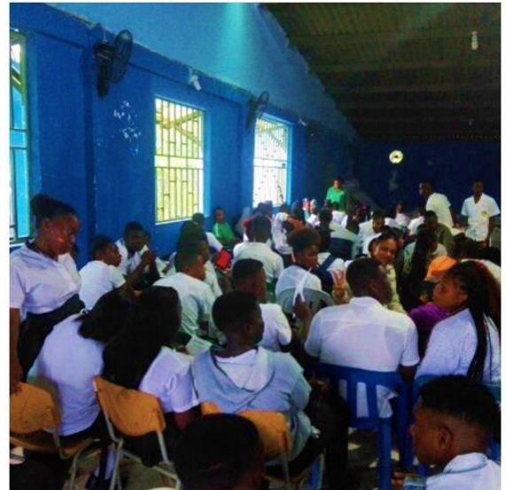
CRM Chocó 22 de marzo de 2018