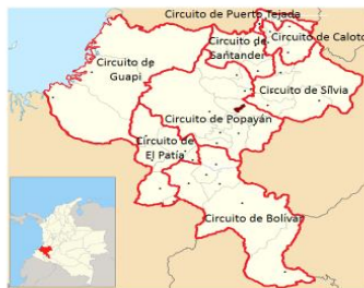
Distrito Judicial de Popayán

Los distritos judiciales de Popayán y administrativo del Cauca, coincide en su mayoría con el territorio del Departamento del Cauca. Departamento situado en la zona sur-occidental de Colombia. Hace parte de las regiones Andina, Pacífica y Amazónica. Con una superficie aproximada de 29.308 km 2 , equivalente al 2.7% del territorio nacional. Con una altitud desde el nivel del mar hasta los 5.780 metros. Está dividido administrativamente en 42 municipios, siendo su capital Popayán. Según las personas censadas en el 2018, en el Departamento habitan 1.243.503 personas, de los cuales se auto reconoce como afrocolombiana un total de 245.362 personas que residen mayoritariamente en la Subregión Norte y pacífica (Santander de Quilichao, Puerto Tejada, Guapi), y como población indígena 308.455 habitantes que se concentran principalmente en la subregión Norte. (Toribio y Caldon), y en la subregión centro (Silvia).