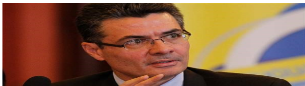
Alejandro Gaviria, ministro de Salud

El ministro de Salud, Alejandro Gaviria, reconoció en diálogo con EL TIEMPO que las violencias de género evidenciadas en la Encuesta Nacional de Demografía y Salud (Ends) 2015 “siguen representando un grave problema de salud pública”.