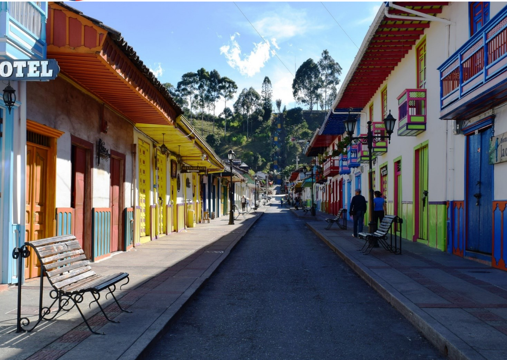
Arquitectura Colonial en Salento - Quindío

EL CONSEJO SUPERIOR DE LA JUDICATURA RINDE CUENTAS 2022