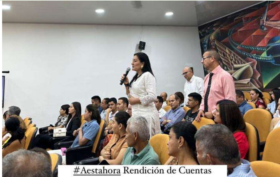
#Aestahora Rendición de Cuentas - Dirección Seccional de Administración Judicial de Ibagué & Consejo Seccional de la Judicatura del Tolima