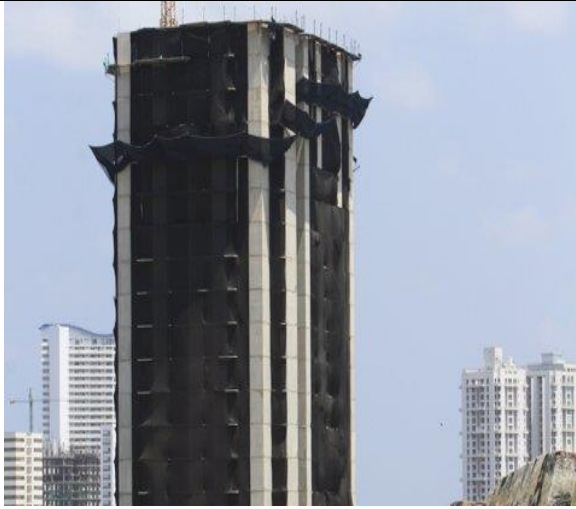
Figura 4. Sistema de cerramiento de seguridad provisional.