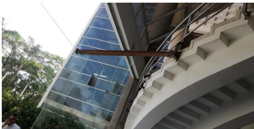
Figura No 1. Situación actual soporte de fachada en primer piso Centro Cívico.