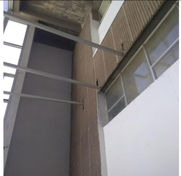
Figuras 2 y 3. Situación actual soporte de fachada en segundo piso de Centro Cívico.