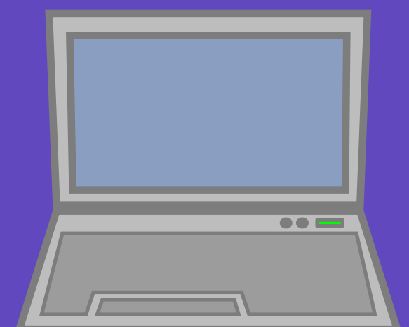
Sitios de interés