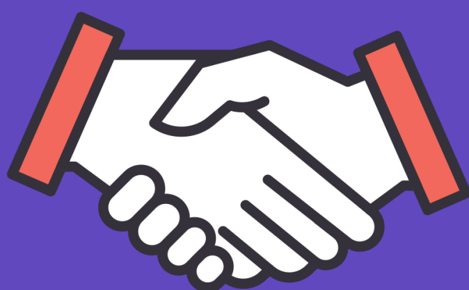
Módulo de ayuda