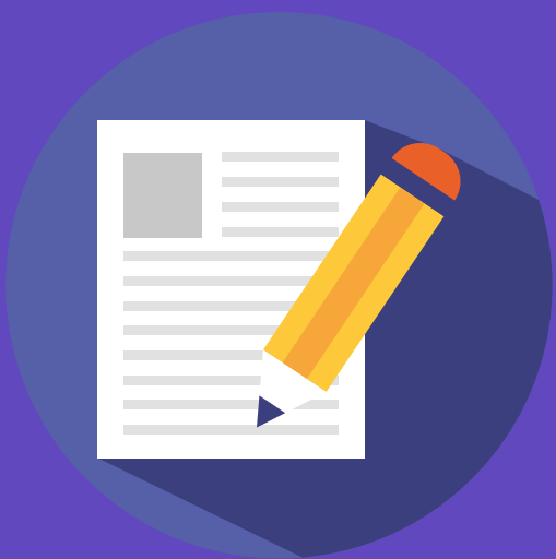
Cursos y talleres