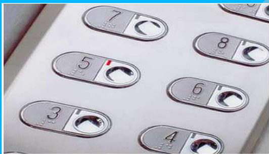
Botonera High Protection

SISTEMA DE BOTONERAS. Botonera de cabina: Teclado tipo Mecánico anti vandálico (high protection), incluye las siguientes opciones: