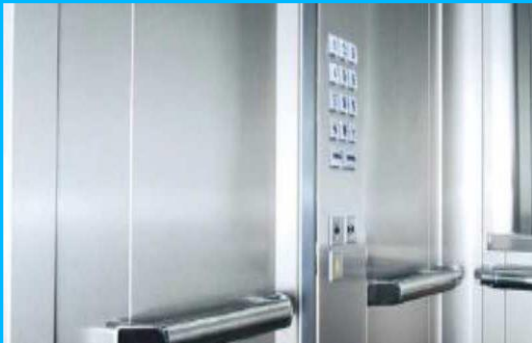
Cabina acabada en acero Inoxidable Botonera de piso High Indicador de posición Hall Indicador de posición Cabina