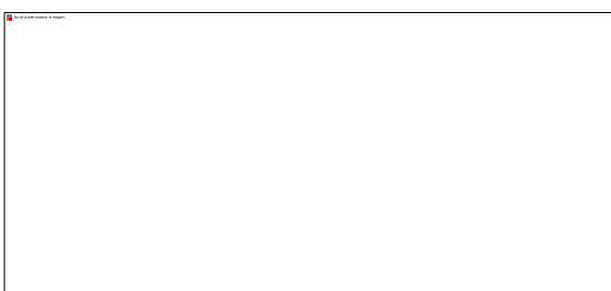
Imagen No. 6:

Conexión a través de un solo dispositivo: Para facilitar el desarrollo de la audiencia, los intervinientes no deben conectarse simultáneamente a través de dos dispositivos (computador, tabletas o teléfonos móviles, por ejemplo).