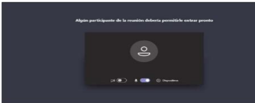
Imagen No. 5:

Cuando el usuario inserte su nombre y seguidamente dé clic en la opción “Unirse ahora”, como lo ilustra la pasada imagen # 4, de forma inmediata a los que ya están conectados a la audiencia, les aparecerá de manera muy visible un cuadro ofreciendo la opción de admitir con un clic al usuario, siendo un ejemplo de esto la siguiente imagen # 6: