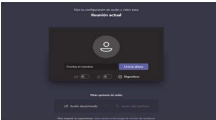
Imagen No. 3:

El paso siguiente es insertar su nombre, apellido y número de cédula de ciudadanía, y seguidamente hacer clic en “Unirse ahora”, como lo ilustra la siguiente imagen # 4, a título de ejemplo: