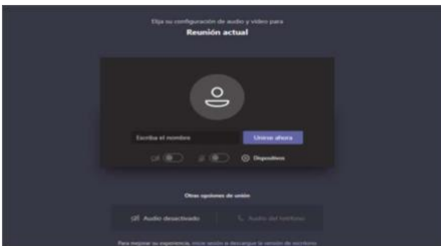
Imagen No. 3:

El paso siguiente es insertar su nombre, apellido y número de cédula de ciudadanía, y seguidamente hacer clic en “Unirse ahora”, como lo ilustra la siguiente imagen # 4, a título de ejemplo: