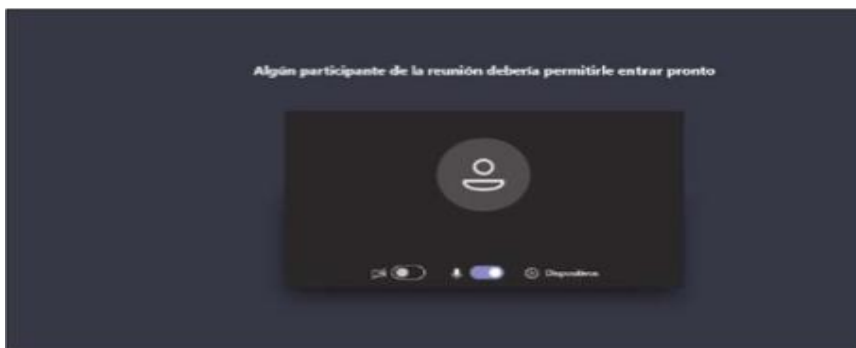
Imagen No. 5:

Cuando el usuario inserte su nombre y seguidamente dé clic en la opción “Unirse ahora”, como lo ilustra la pasada imagen # 4, de forma inmediata a los que ya están conectados a la audiencia, les aparecerá de manera muy visible un cuadro ofreciendo la opción de admitir con un clic al usuario, siendo un ejemplo de esto la siguiente imagen # 6: