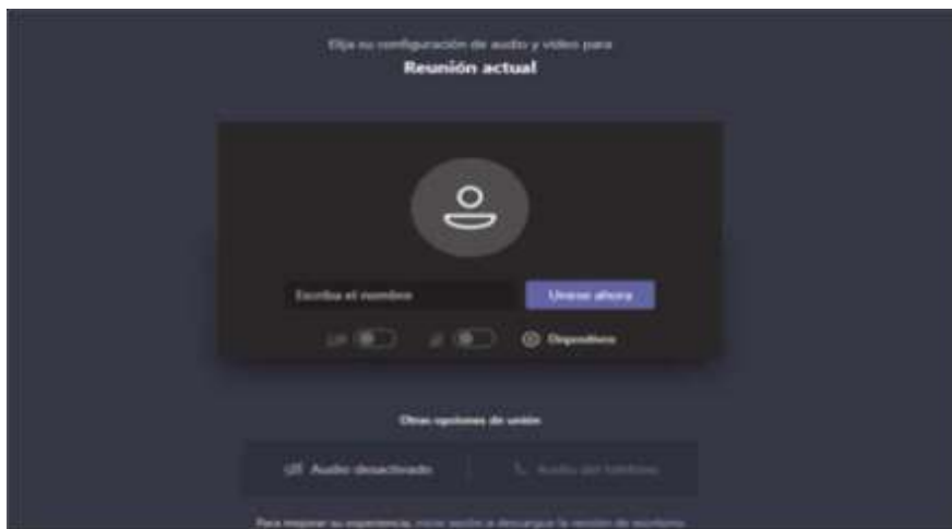
Imagen No. 3:

Código: FCA - 002 Versión: 02 Fecha: 31-07-2017