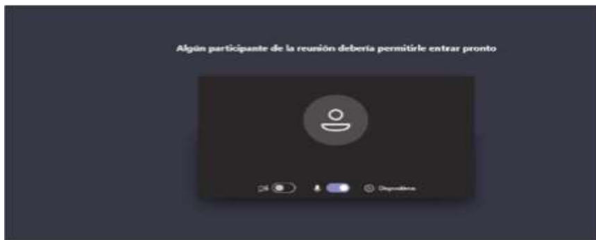
Imagen No. 5:

Después de lo anterior, el acceso a la audiencia virtual quedará en espera hasta cuando el funcionario judicial que preside la audiencia, o incluso cualquier otro participante que haya ya accedido, lo admita a la audiencia, y mientras tanto le aparecerá al usuario una ventana igual o similar a la de la siguiente imagen: