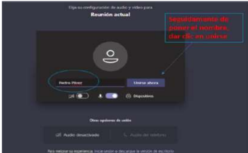
Imagen No. 4:

Después de lo anterior, el acceso a la audiencia virtual quedará en espera hasta cuando el funcionario judicial que preside la audiencia, o incluso cualquier otro participante que haya ya accedido, lo admita a la audiencia, y mientras tanto le aparecerá al usuario una ventana igual o similar a la de la siguiente imagen: