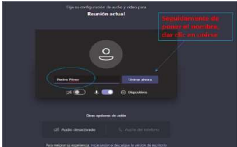
Imagen No. 4:

Después de lo anterior, el acceso a la audiencia virtual quedará en espera hasta cuando el funcionario judicial que preside la audiencia, o incluso cualquier otro participante que haya ya accedido, lo admita a la audiencia, y mientras tanto le aparecerá al usuario una ventana igual o similar a la de la siguiente imagen: