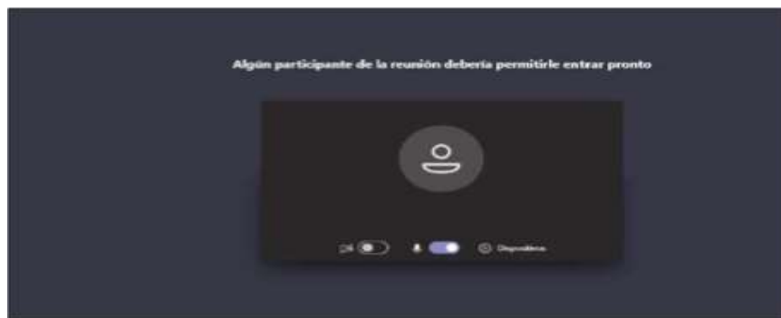
Imagen No. 5:

Cuando el usuario inserte su nombre y seguidamente dé clic en la opción “Unirse ahora”, como lo ilustra la pasada imagen # 4, de forma inmediata a los que ya están conectados a la audiencia, les aparecerá de manera muy visible un cuadro ofreciendo la opción de admitir con un clic al usuario, siendo un ejemplo de esto la siguiente imagen # 6: