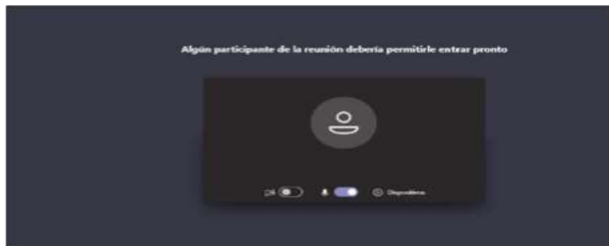
Imagen No. 5:

Cuando el usuario inserte su nombre y seguidamente dé clic en la opción “Unirse ahora”, como lo ilustra la pasada imagen # 4, de forma inmediata a los que ya están conectados a la audiencia, les aparecerá de manera muy visible un cuadro ofreciendo la opción de admitir con un clic al usuario, siendo un ejemplo de esto la siguiente imagen # 6: