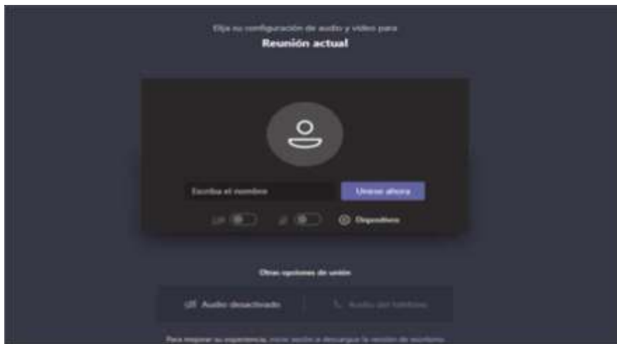
Imagen No. 3:

El paso siguiente es insertar su nombre, apellido y número de cédula de ciudadanía, y seguidamente hacer clic en “Unirse ahora”, como lo ilustra la siguiente imagen # 4, a título de ejemplo: