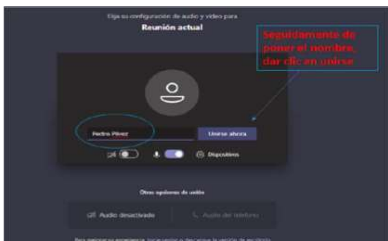
Imagen No. 4:

Después de lo anterior, el acceso a la audiencia virtual quedará en espera hasta cuando el funcionario judicial que preside la audiencia, o incluso cualquier otro participante que haya ya