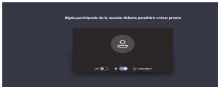
Imagen No. 5:

Cuando el usuario inserte su nombre y seguidamente dé clic en la opción “Unirse ahora”, como lo ilustra la pasada imagen # 4, de forma inmediata a los que ya están conectados a la audiencia, les aparecerá de manera muy visible un cuadro ofreciendo la opción de admitir con un clic al usuario, siendo un ejemplo de esto la siguiente imagen # 6: