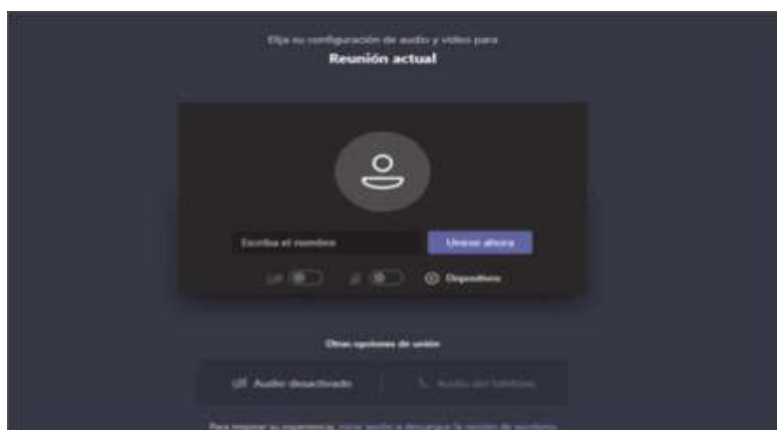
Imagen No. 3:

El paso siguiente es insertar su nombre, apellido y número de cédula de ciudadanía, y seguidamente hacer clic en “Unirse ahora”, como lo ilustra la siguiente imagen # 4, a título de ejemplo: