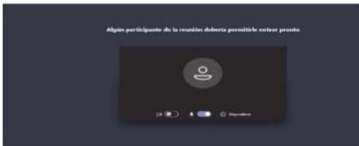
Imagen No. 5:

Cuando el usuario inserte su nombre y seguidamente dé clic en la opción “Unirse ahora”, como lo ilustra la pasada imagen # 4, de forma inmediata a los que ya están conectados a la audiencia, les aparecerá de manera muy visible un cuadro ofreciendo la opción de admitir con un clic al usuario, siendo un ejemplo de esto la siguiente imagen # 6: