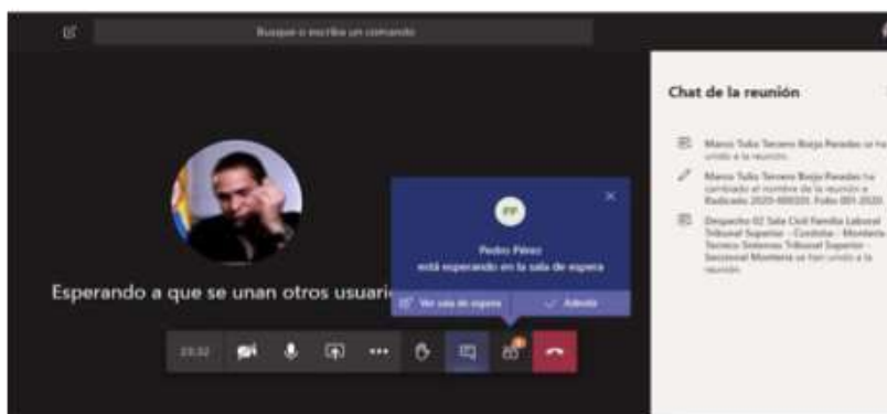
Imagen No. 6:

Cuando el usuario inserte su nombre y seguidamente dé clic en la opción “Unirse ahora”, como lo ilustra la pasada imagen # 4, de forma inmediata a los que ya están conectados a la audiencia, les aparecerá de manera muy visible un cuadro ofreciendo la opción de admitir con un clic al usuario, siendo un ejemplo de esto la siguiente imagen # 6: