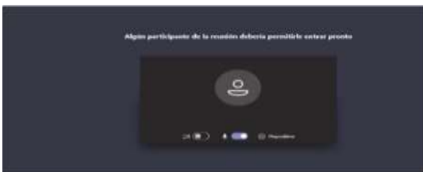
Imagen No. 5:

Cuando el usuario inserte su nombre y seguidamente dé clic en la opción “Unirse ahora”, como lo ilustra la pasada imagen # 4, de forma inmediata a los que ya están conectados a la audiencia, les aparecerá de manera muy visible un cuadro ofreciendo la opción de admitir con un clic al usuario, siendo un ejemplo de esto la siguiente imagen # 6: