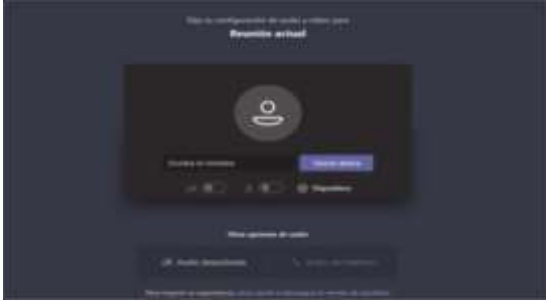
Imagen No. 3:

El paso siguiente es insertar su nombre, apellido y número de cédula de ciudadanía, y seguidamente hacer clic en “Unirse ahora”, como lo ilustra la siguiente imagen # 4, a título de ejemplo: