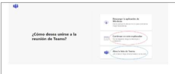
Imagen No. 2:

Si el usuario ya cuenta con la aplicación teams, podrá hacer clic en la opción que aparece encerrada con el círculo azul (“Abrir la lista de teams”), y, con ello, accede enseguida a la audiencia virtual; y, si no tiene dicha aplicación, deberá hacer clic en la opción que aparece