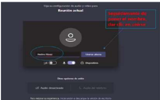
Imagen No. 4:

Después de lo anterior, el acceso a la audiencia virtual quedará en espera hasta cuando el funcionario judicial que preside la audiencia, o incluso cualquier otro participante que haya ya accedido, lo admita a la audiencia, y mientras tanto le aparecerá al usuario una ventana igual o similar a la de la siguiente imagen: