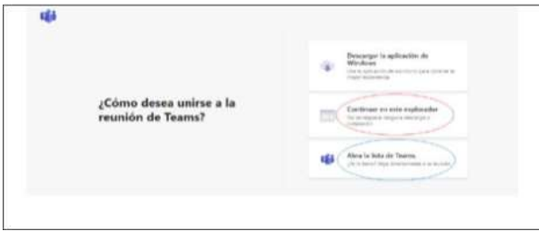
Imagen No. 2:

Si el usuario ya cuenta con la aplicación teams, podrá hacer clic en la opción que aparece encerrada con el círculo azul (“Abrir la lista de teams”), y, con ello, accede enseguida a la audiencia virtual; y, si no tiene dicha aplicación, deberá hacer clic en la opción que aparece encerrada con círculo rojo (“Continuar en este explorador”), evento en el cual le aparecerá posteriormente una ventana igual o similar a la de la siguiente imagen: