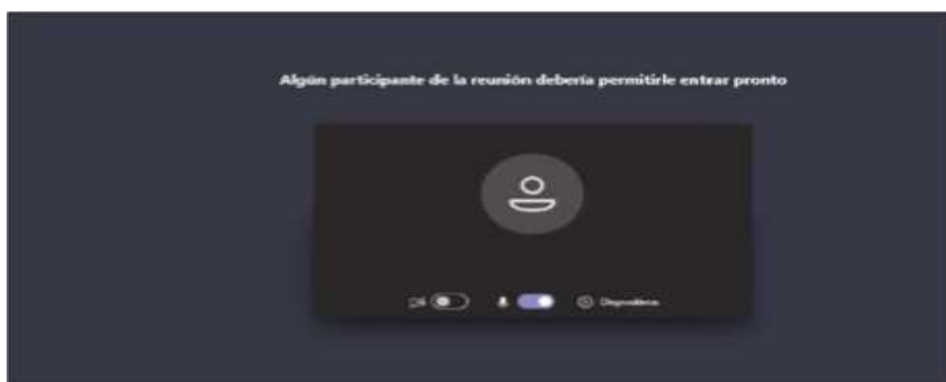
Imagen No. 5:

Cuando el usuario inserte su nombre y seguidamente dé clic en la opción “Unirse ahora”, como lo ilustra la pasada imagen # 4, de forma inmediata a los que ya están conectados a la audiencia, les aparecerá de manera muy visible un cuadro ofreciendo la opción de admitir con un clic al usuario, siendo un ejemplo de esto la siguiente imagen # 6: