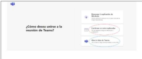
Imagen No. 2:

Si el usuario ya cuenta con la aplicación teams, podrá hacer clic en la opción que aparece encerrada con el círculo azul (“Abrir la lista de teams”), y, con ello, accede enseguida a la audiencia virtual; y, si no tiene dicha aplicación, deberá hacer clic en la opción que aparece encerrada con círculo rojo (“Continuar en este explorador”), evento en el cual le aparecerá posteriormente una ventana igual o similar a la de la siguiente imagen: