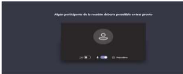
Imagen No. 5:

Cuando el usuario inserte su nombre y seguidamente dé clic en la opción “Unirse ahora”, como lo ilustra la pasada imagen # 4, de forma inmediata a los que ya están conectados a la audiencia, les aparecerá de manera muy visible un cuadro ofreciendo la opción de admitir con un clic al usuario, siendo un ejemplo de esto la siguiente imagen # 6: