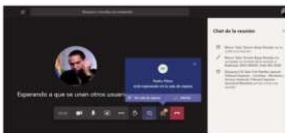
Imagen No. 6:

Conexión a través de un solo dispositivo: Para facilitar el desarrollo de la audiencia, los intervinientes no deben conectarse simultáneamente a través de dos dispositivos (computador, tabletas o teléfonos móviles, por ejemplo).