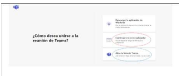
Imagen No. 2:

Si el usuario ya cuenta con la aplicación teams, podrá hacer clic en la opción que aparece encerrada con el círculo azul (“Abrir la lista de teams”), y, con ello, accede enseguida a la audiencia virtual; y, si no tiene dicha aplicación, deberá hacer clic en la opción que aparece