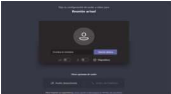
Imagen No. 3:

El paso siguiente es insertar su nombre, apellido y número de cédula de ciudadanía, y seguidamente hacer clic en “Unirse ahora”, como lo ilustra la siguiente imagen # 4, a título de ejemplo: