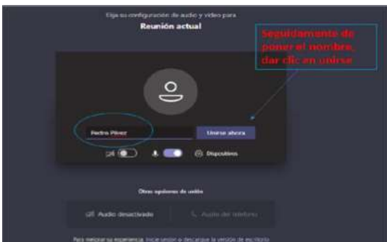
Imagen No. 4:

Después de lo anterior, el acceso a la audiencia virtual quedará en espera hasta cuando el funcionario judicial que preside la audiencia, o incluso cualquier otro participante que haya ya accedido, lo admita a la audiencia, y mientras tanto le aparecerá al usuario una ventana igual o similar a la de la siguiente imagen: