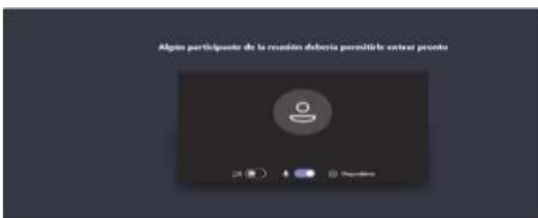
Imagen No. 5:

Después de lo anterior, el acceso a la audiencia virtual quedará en espera hasta cuando el funcionario judicial que preside la audiencia, o incluso cualquier otro participante que haya ya accedido, lo admita a la audiencia, y mientras tanto le aparecerá al usuario una ventana igual o similar a la de la siguiente imagen: