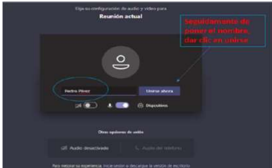
Imagen No. 4:

Después de lo anterior, el acceso a la audiencia virtual quedará en espera hasta cuando el funcionario judicial que preside la audiencia, o incluso cualquier otro participante que haya ya accedido, lo admita a la audiencia, y mientras tanto le aparecerá al usuario una ventana igual o similar a la de la siguiente imagen: