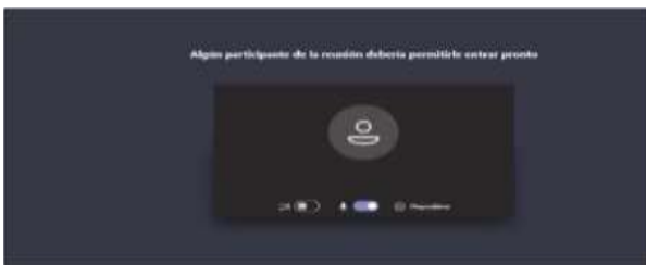
Imagen No. 5:

Cuando el usuario inserte su nombre y seguidamente dé clic en la opción “Unirse ahora”, como lo ilustra la pasada imagen # 4, de forma inmediata a los que ya están conectados a la audiencia, les aparecerá de manera muy visible un cuadro ofreciendo la opción de admitir con un clic al usuario, siendo un ejemplo de esto la siguiente imagen # 6: