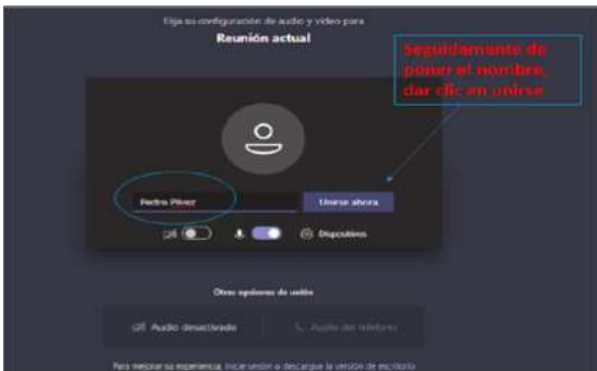
Imagen No. 4:

Después de lo anterior, el acceso a la audiencia virtual quedará en espera hasta cuando el funcionario judicial que preside la audiencia, o incluso cualquier otro participante que haya ya accedido, lo admita a la audiencia, y mientras tanto le aparecerá al usuario una ventana igual o similar a la de la siguiente imagen: