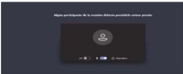
Imagen No. 5:

Cuando el usuario inserte su nombre y seguidamente dé clic en la opción “Unirse ahora”, como lo ilustra la pasada imagen # 4, de forma inmediata a los que ya están conectados a