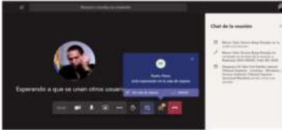
Imagen No. 6:

Conexión a través de un solo dispositivo: Para facilitar el desarrollo de la audiencia, los intervinientes no deben conectarse simultáneamente a través de dos dispositivos (computador, tabletas o teléfonos móviles, por ejemplo).