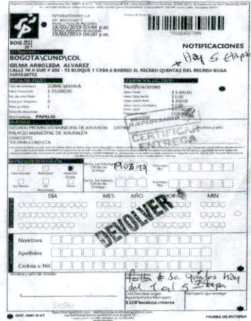
IMAGEN PRUEBA DE ENTREGA DE LA DEVOLUCIÓN