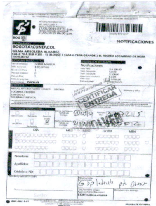
IMAGEN PRUEBA DE ENTREGA DE LA DEVOLUCIÓN