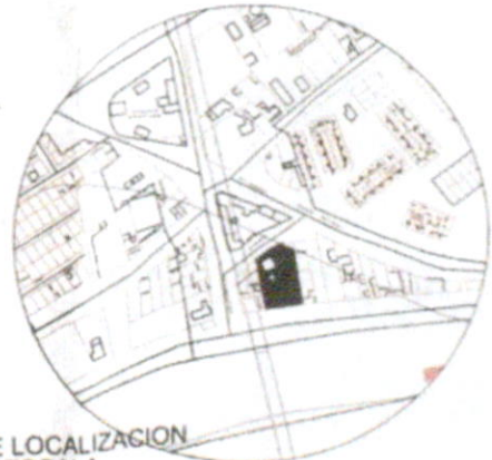
PLANO DE LOCALIZACION SIN ESCALA

INGAMEZ CONSTRUCCIONES - TOCAIMA - UNO - TEL: 311 241 0111 - E-MAIL: ingamez@ingamez.com.co