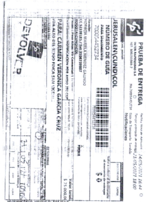
IMAGEN PRUEBA DE ENTREGA DE LA DEVOLUCIÓN