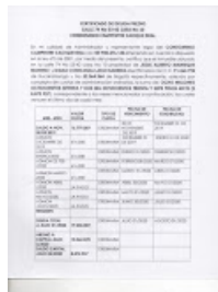
OFICIO JUZG.HOJA 1.jpeg 1119K