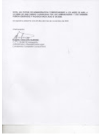
OFICIO JUZG HOJA 2.jpeg 827K