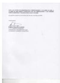
OFICIO JUZG HOJA 2.jpeg 827K