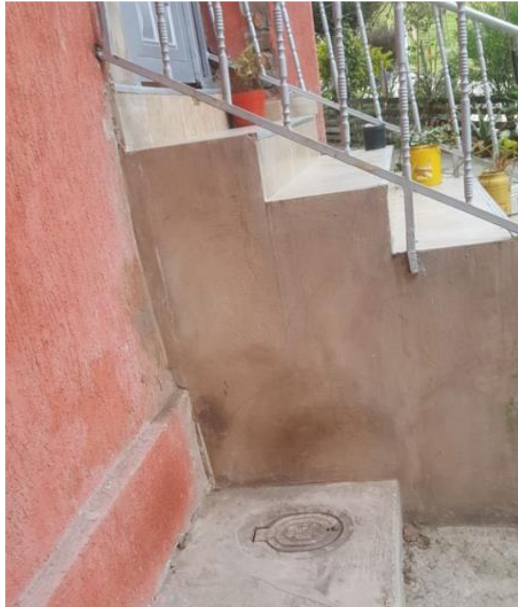
CONTADOR DEL AGUA PREDIO CARRERA 7 # 3-51 SUR 1ER PISO