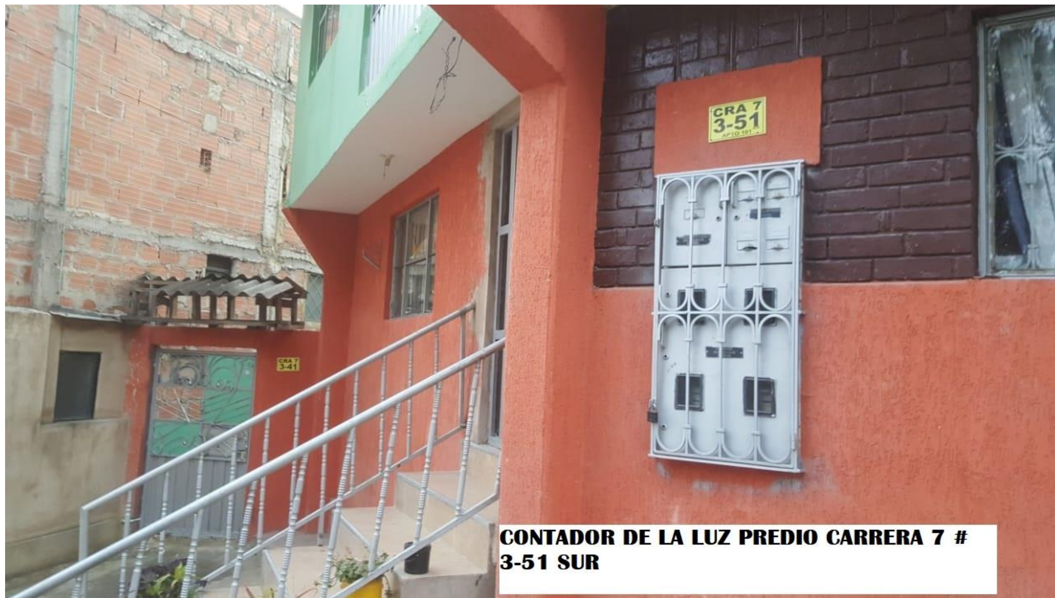
CONTADOR DE LA LUZ PREDIO CARRERA 7 # 3-51 SUR