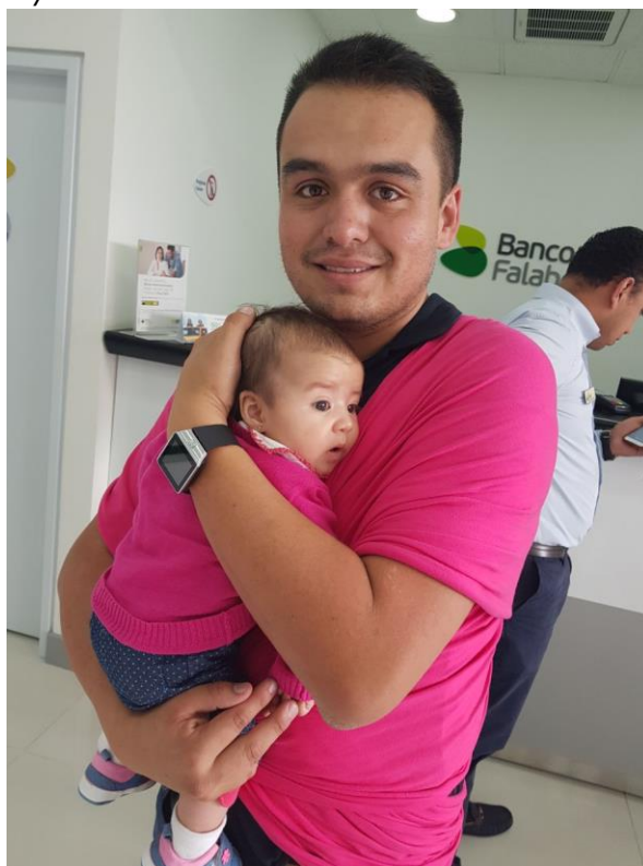
Fotografía del 29 de abril de 2018, donde el señor Anderson lleva a su hija de paseo