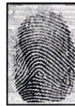
Huella Registro Electrónico