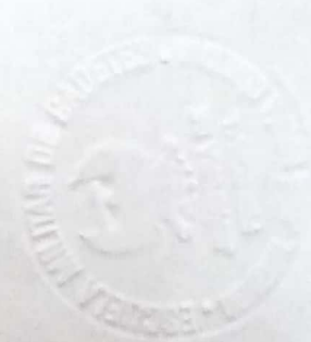
Mayor MAURICIO MESU OROZCO Oficial B-1 Escuela Militar de Cadetes

2022 AÑO DEL LIDERAZGO, LA MORAL COMBATIVA Y LA CONTUNDENCIA OPERACIONAL