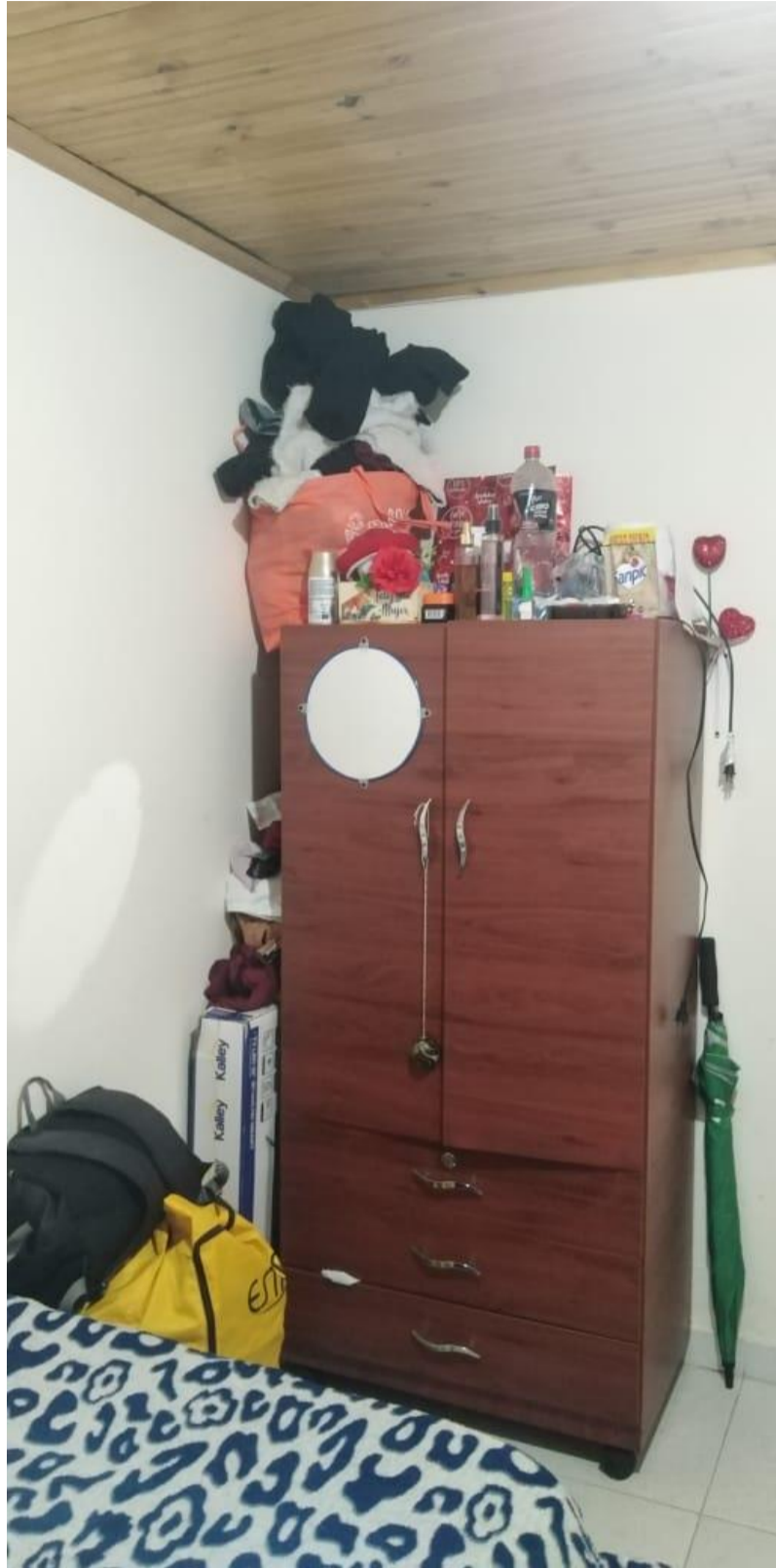
ALCOBA DE JOSÉ MESÍAS Y SU ACTUAL PAREJA