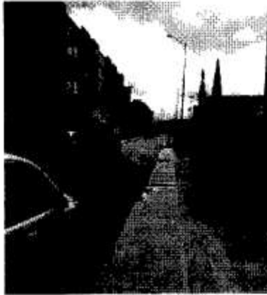
VIA DE ACCESO