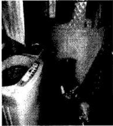
ZONA DE ROPAS - PATIO