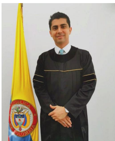
CARLOS ANDRÉS PÉREZ ALARCÓN PRESIDENTE